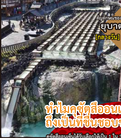
สัญลักษณ์ของคุซัตสึออนเซ็น ยูปาตาเกะ [กลางวัน] [กลางคืน]